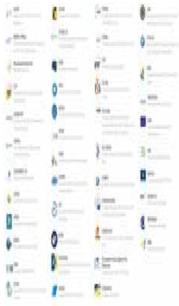
2. Ilustración: Logos de las agencias y organismos de la UE

Son organismos creados en 2011 a raíz de la crisis financiera internacional y su función es mejorar la supervisión del sistema financiero europeo.